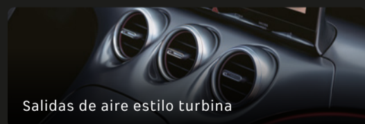
Salidas de aire estilo turbina