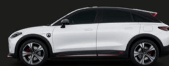
Digital White / Eclipse Black