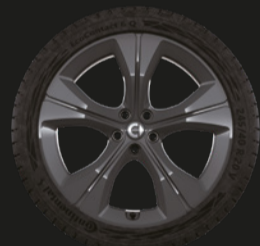
20" Synchro-245/40 R20