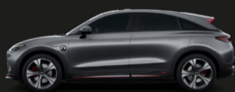
Atom Grey – Matte